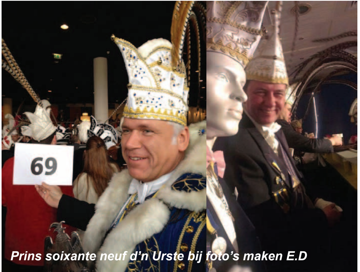
Prins soixante neuf d'n Urste bij foto's maken E.D