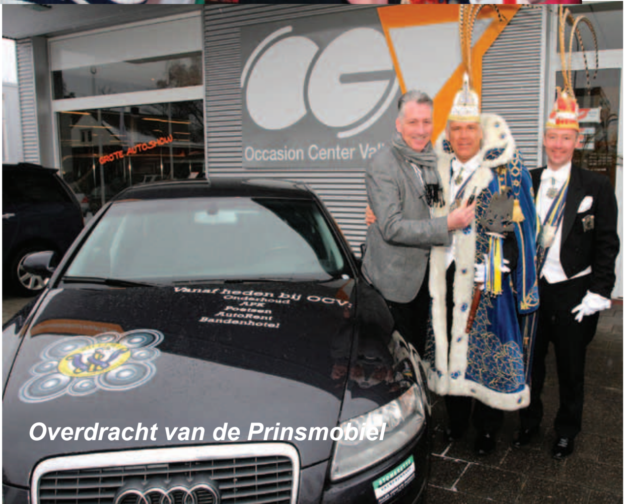
Overdracht van de Prinsmobiel