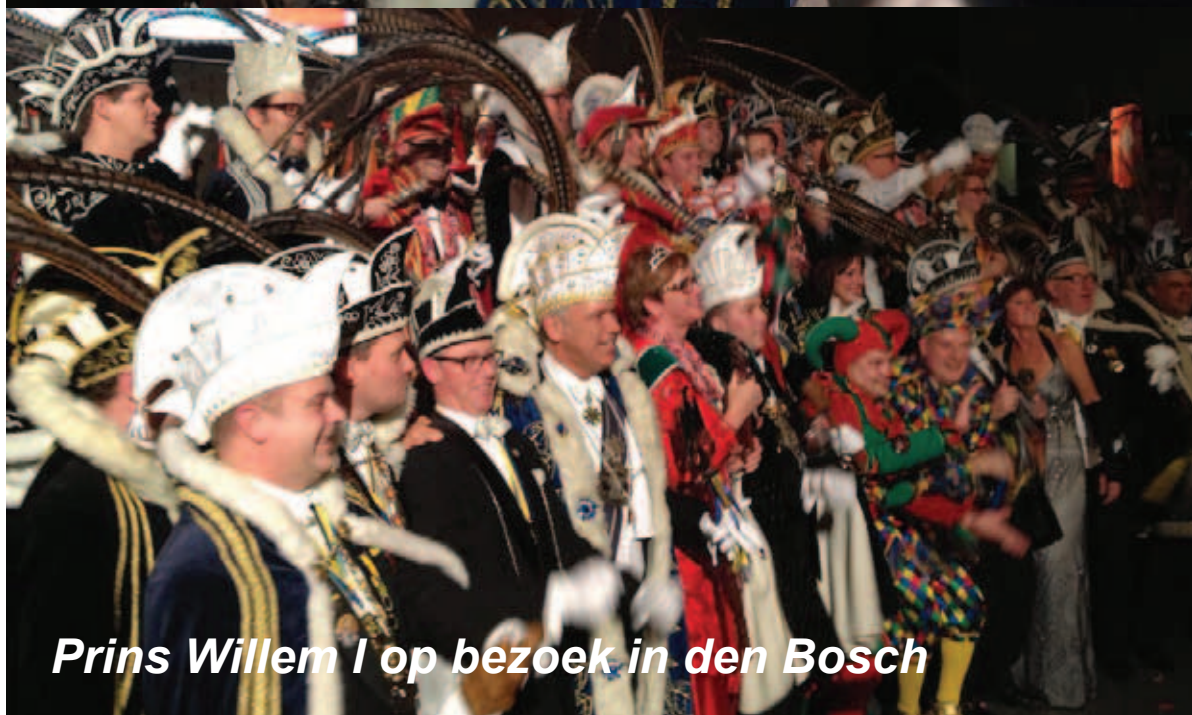
Prins Willem I op bezoek in den Bosch