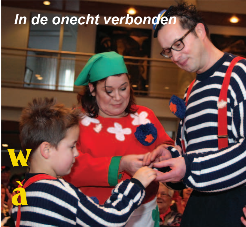
In de onecht verbonden